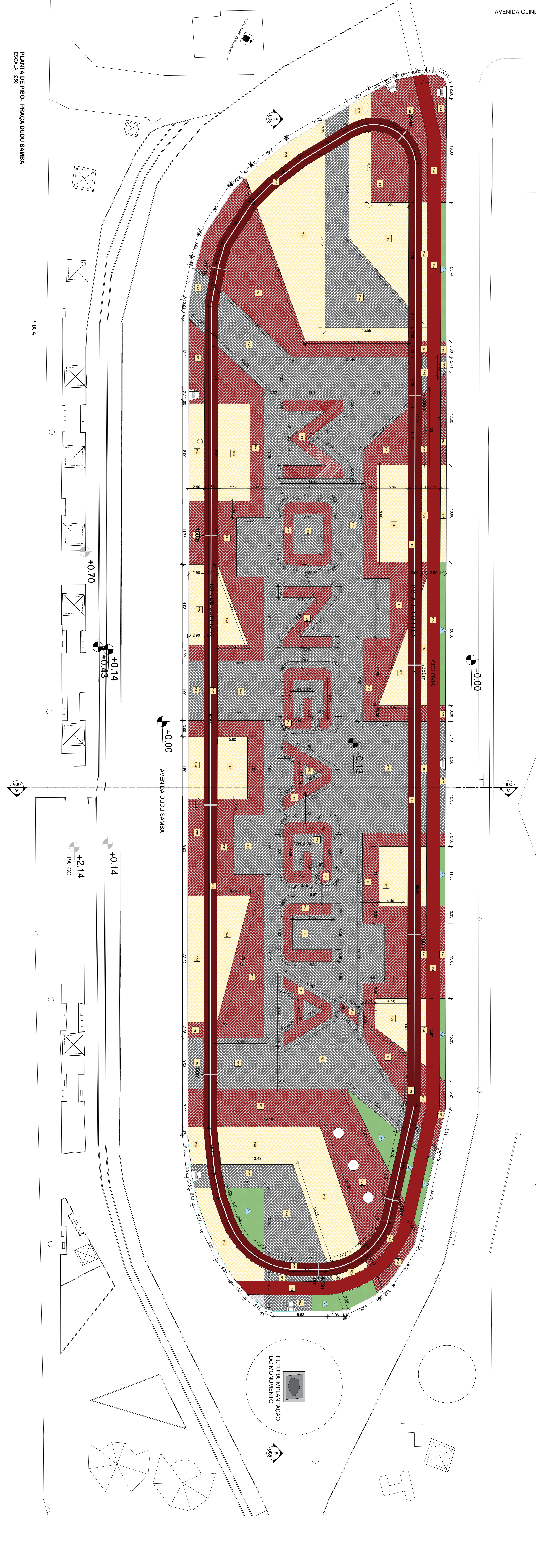
PLANTA DE PISO - PRAÇA DUDU SAMBA ESCALA: 1/250